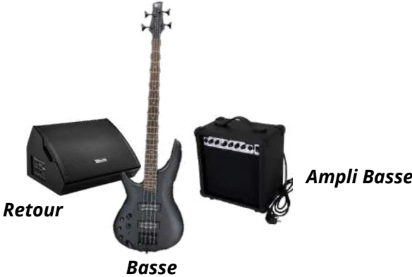
Retour Basse Ampli Basse