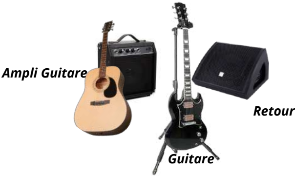
Ampli Guitare Guitare Retour